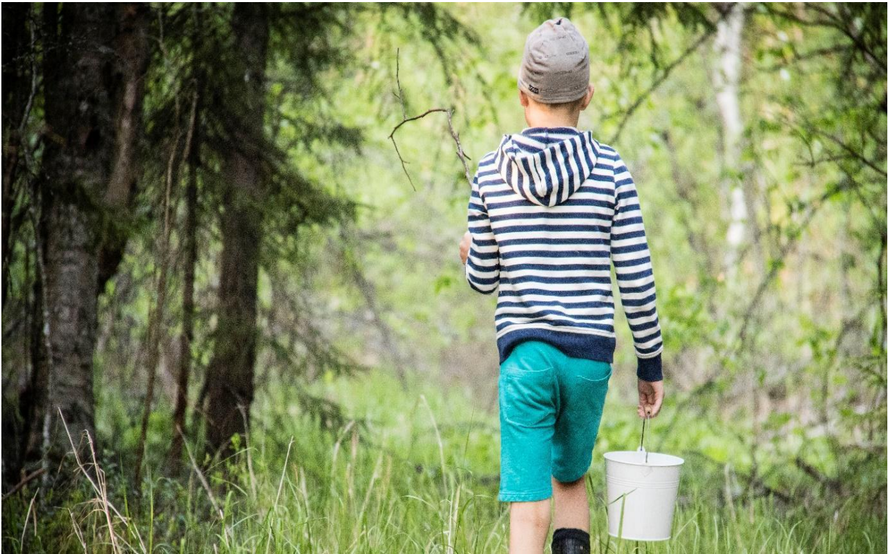
Kuva: Anu-Maija Kärjä

Tarkoitukseni on kertoa kuvituksella kasvun kaikista vaiheista, koko elämän kirjosta. Pienen paneutumisen kautta löysin myös yksinkertaisen vastauksen siihen, miltä translapsi näyttää: ihan tavalliselta lapselta tietenkin!